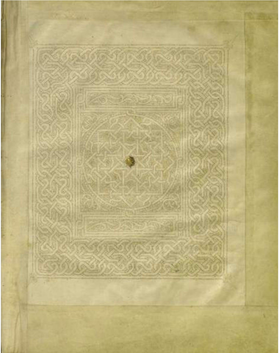
Fig. 1. Bíblia Hebraica. Sevilha (?), c.1470. Biblioteca Geral da Universidade de Coimbra, Coimbra, Cofre 1, fol. 384v.