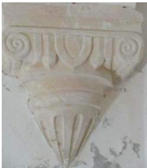
Fig. 10. Mísula jónica. Cripta da Colegiada de Ourém.