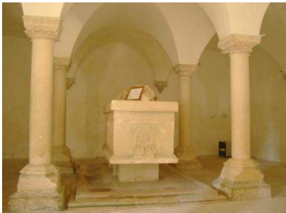
Fig. 9. Interior da cripta da Colegiada de Ourém. Meados século XV.