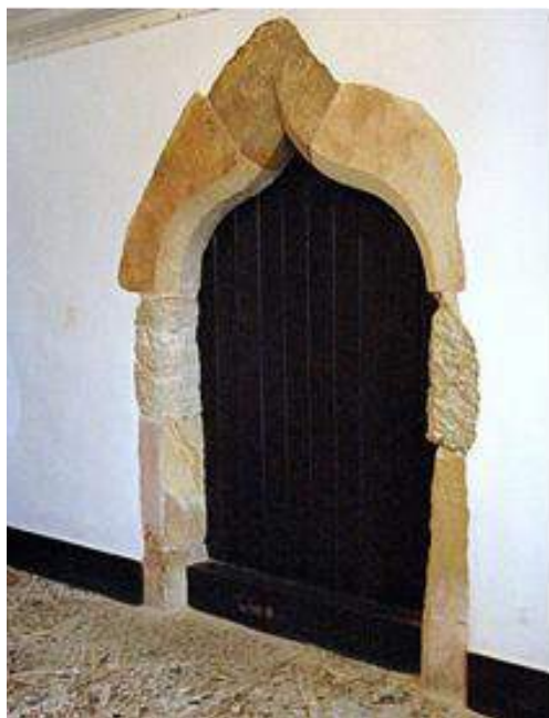
Fig. 12. Arco contracurvado do antigo vão de acesso à sala de orações da Sinagoga de Tomar.