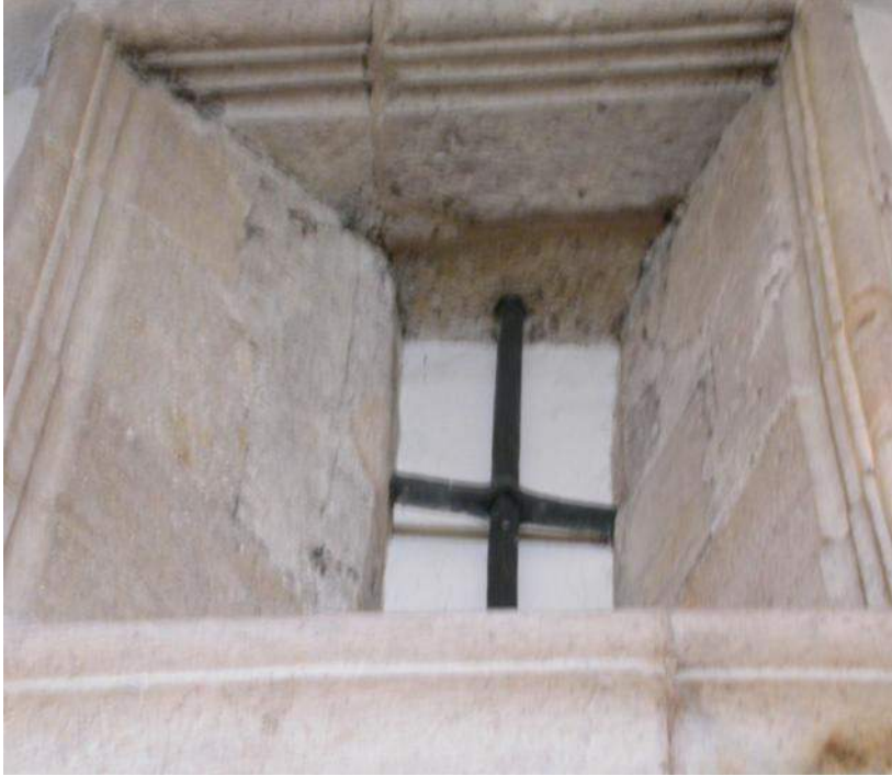
Fig. 7. Janela de moldura reta. Sinagoga de Tomar.