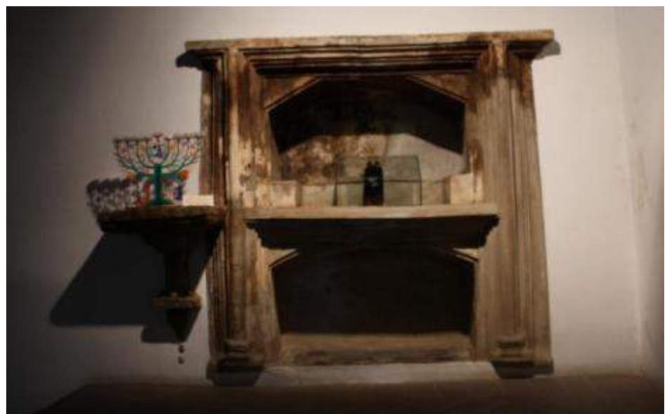
Fig. 6. Hipotético Hekhal (Castelo de Vide).