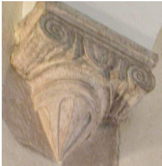
Fig. 8. Mísula jónica. Sinagoga de Tomar.