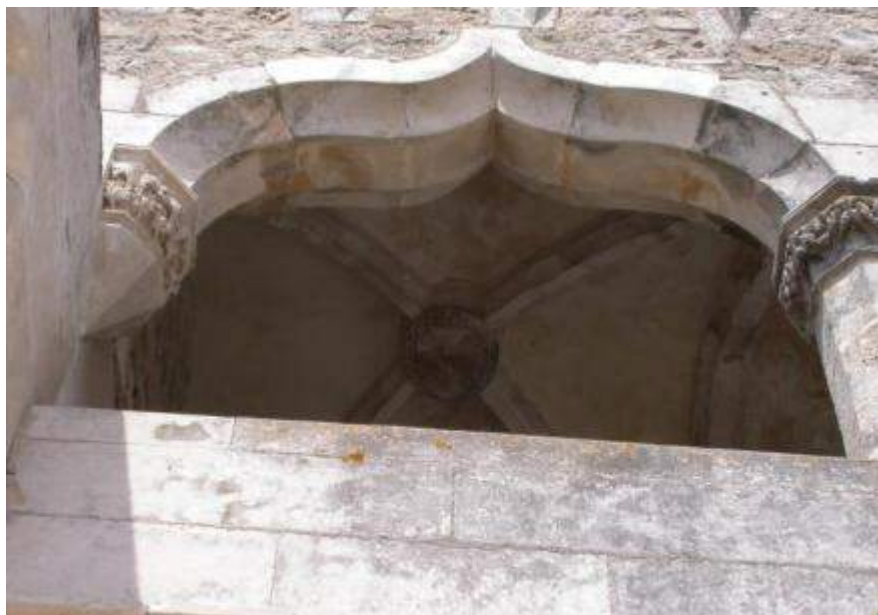
Fig. 13. Arco contracurvado. Varanda do Paço de Porto de Mós.