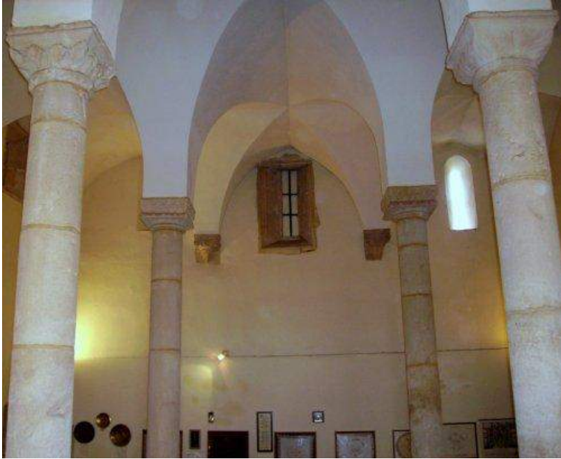
Fig. 3. Sinagoga de Tomar. Meados do século XV.