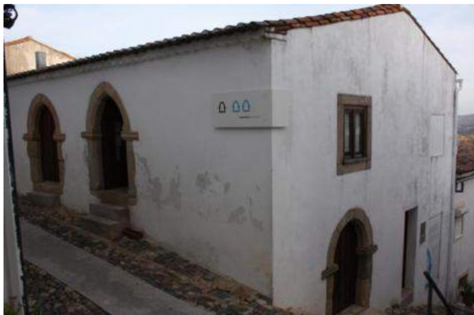
Fig. 5. Exterior da hipotética sinagoga de Castelo de Vide.