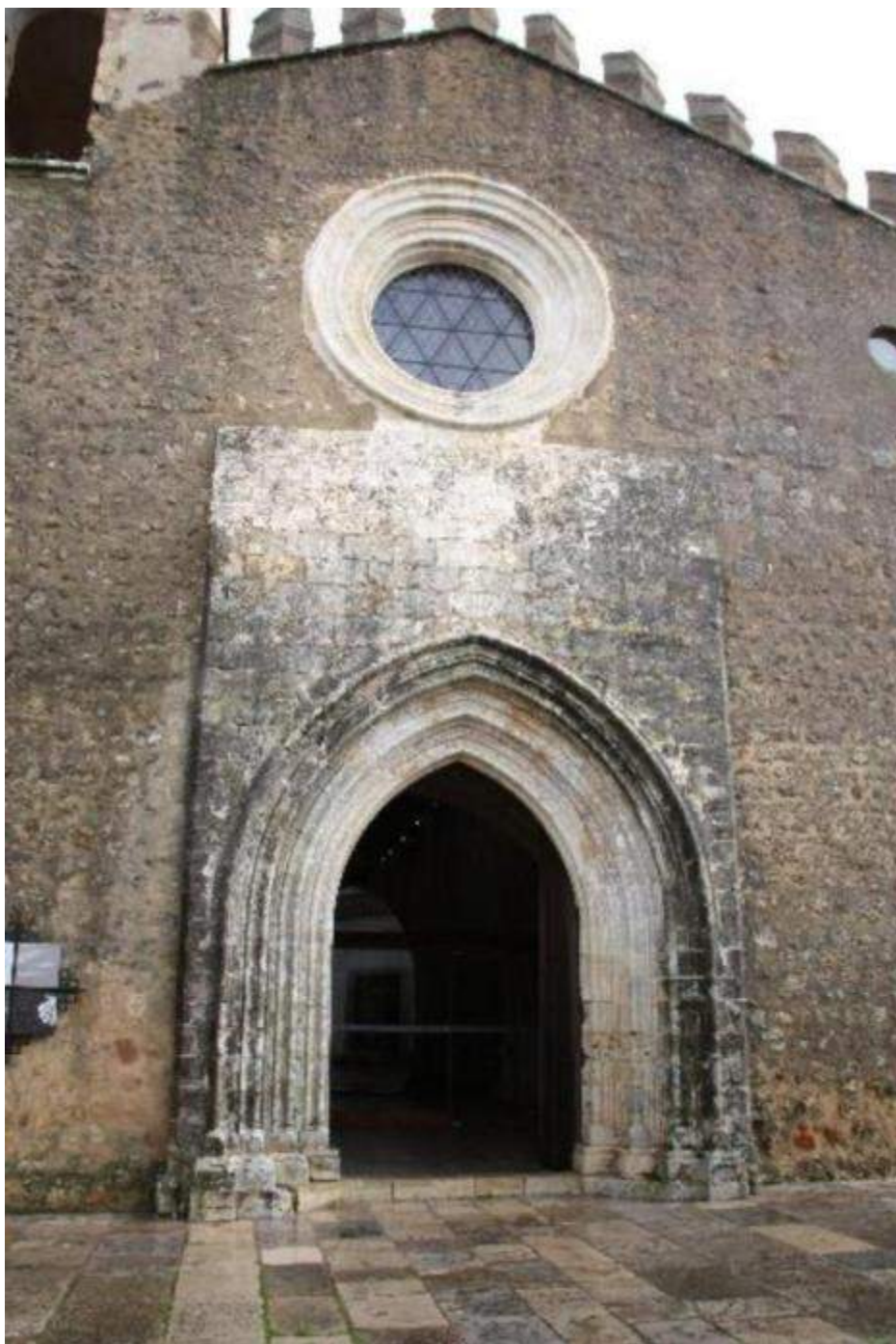
Fig. 11. Portal principal da igreja de Santiago, Palmela.