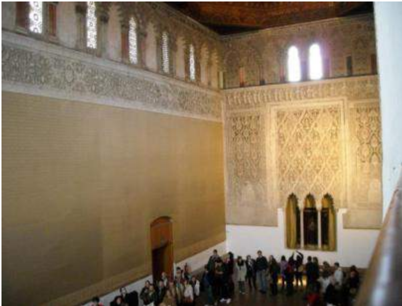
Fig. 4. Sinagoga de Samuel Ha-Levi (Toledo), 1357-1363.